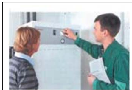
Eine Warmwasserwärmepumpe (hier ein Modell von Stiebel Eltron) kann an vielen Stellen im Haus aufgestellt werden – im Gegensatz zum Schichtspeicher einer Solarthermieanlage

Dimplex Deutschland GmbH propagieren daher ebenso wie das BSW-Mitglied Centrosolar AG die Photovoltaik zur Warmwassererzeugung im Haushalt. Sie bieten Warmwasserwärmepumpen mit integriertem Speicher zur Kombination mit Solarmodulen und Wechselrichtern an, teilweise sogar im Komplettpaket. Es steht zu vermuten, dass demnächst weitere Anbieter auf den Markt drängen werden. Denn auch bei der Robert Bosch GmbH – mit den Töchtern Junkers und Buderus einer der größten Heizungsfabrikanten des Landes –, der Schüco International KG und der Viessmann Werke GmbH & Co. KG hat man längst sämtliche Bausteine für die Photovoltaik-Wärmepumpen-Kombination im Sortiment. Sie müssen nur noch zu groß-handelsfähigen Päckchen geschnürt werden. »Die Solarthermie ist bedroht durch die Photovoltaik«, konstatiert denn auch ein Mitglied der Photovoltaikbranche, das mit dieser Aussage nicht öffentlich genannt werden möchte – aus Angst vor einem Streit im Solarverband.