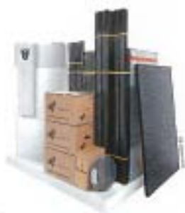
Wärmepumpe und Solarstromanlage als Komplettpaket – darauf setzt man bei Centrosolar

Energiewende wird außer Acht gelassen, dass wir schon viele Energiespeicher im Haus stehen haben. Wir versuchen das Potenzial zu heben, das in vielen Tausenden Haushalten vorhanden ist«, sagt Stiebel-Eltron-Sprecher Schulz. Die Wärmepumpe ist dazu gar nicht unbedingt nötig, es funktioniert auch schon mit einem einfachen Brauchwasserspeicher, wie er sich in fast jedem Heizungskeller findet samt intelligenter Wärmepatrone. Völlig neu ist das Thema »Netzentlastung durch Stromspeicher« nicht: Als in den 1970er-Jahren die neu gebauten Atomkraftwerke in den Nachtstunden Strom im Überfluss in die Netze drückten, wurden massenhaft Nachtspeicherheizungen eingeführt, um die Überschussenergie aufzunehmen. Etwas Ähnliches könnte nun auch mit der Kombination aus elektrischen Wärmeerzeugern und Erneuerbare-Energien-Anlagen geschehen. Das Einzige, was dafür noch fehlt, ist ein System, das den Heizern mitteilt, wann sie anspringen sollen. Bei Stiebel Eltron denkt man daher in Richtung Smart Grids und Prognosen für die Solar- und Windleistung. Wenn dadurch bekannt wäre, wie viel und wie lange Wind und Sonne Energie liefern, so wüsste man auch, wann es Zeit ist, die Wärmespeicher aufzuheizen.