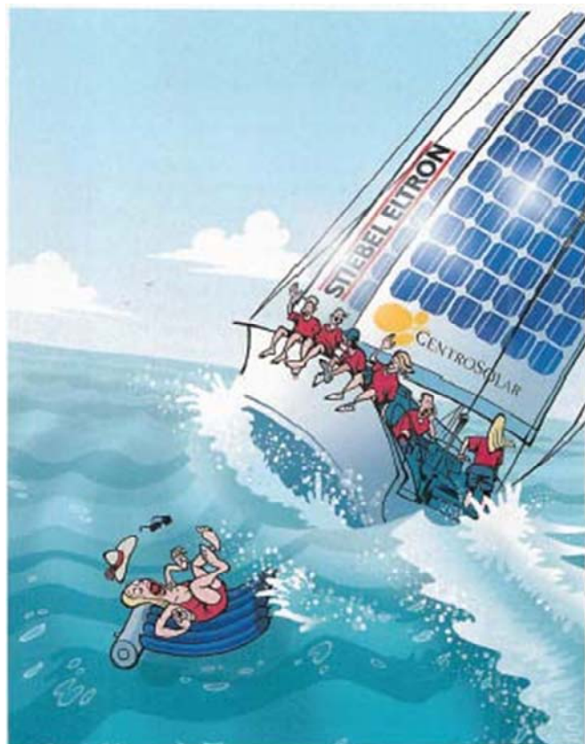
Die Solarthermie dümpelte bislang vor sich hin. Damit ist es bald vorbei.

Wer warmes Wasser haben möchte, setzt dazu inzwischen besser auf das Silizium in der Photovoltaikanlage und eine Wärmepumpe – und nicht auf Glas und Kupfer in Solarthermiekollektoren. Das elektrische Wärmesystem ist deutlich günstiger, lässt sich ungleich einfacher auslegen und wird mit sinkenden Anlagenpreisen auch noch immer billiger. Außerdem bringt es dem Stromnetz ein paar unschlagbare Vorteile.